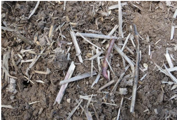
Abb.: Wer die Möglichkeit zur Mulch- oder Direktsaat hat, kann das Bodenleben aktiv fördern. Dieses Bild entstand Ende Mai 2020 auf einer Fläche, die nur 2 cm bearbeitet wurde. Nach wochenlanger Trockenheit – die Krume der Nachbarflächen waren nahezu ausgetrocknet – tummelten sich unter der Mulchschicht Regenwürmer und die Erde war komplett durchfeuchtet.

während ihres Wachstums als auch als Mulchschicht im Frühjahr. Im Gegenzug steigt zwar die Wasserverdunstung durch die Pflanzen (Transpiration), allerdings ist die Transpiration bei den meisten Sorten wesentlich geringer als die Verdunstung über dem freiliegenden Acker. Außerdem fangen Zwischenfrüchte erhebliche Taumengen auf.