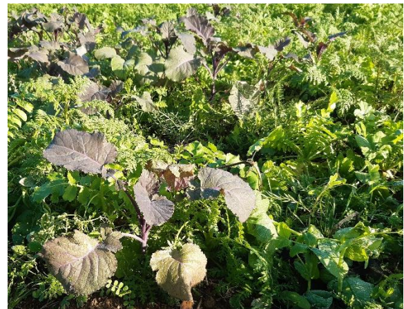
Abb.: Eine für den Silomais entwickelte Zwischenfruchtmischung. Die Mischungspartner nutzen den Platz durch unterschiedlichste Wuchsformen optimal aus und behindern sich dabei nicht.