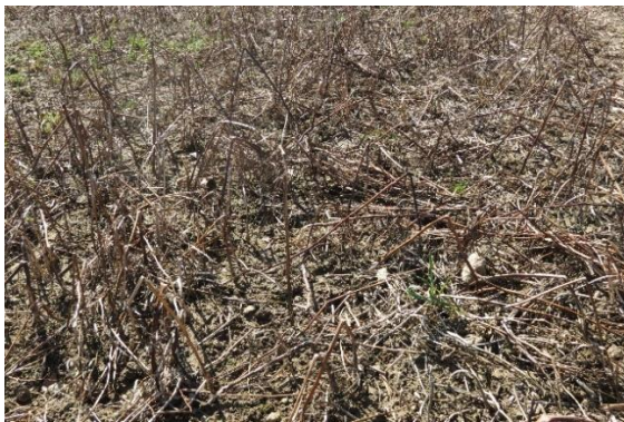
Abb.: Abgefrorene Zwischenfrüchte: Gelbsenf (oben) hinterlässt helles Material, während ein Gemenge, das u.a. Phacelia und Leguminosen enthält, dunkles Material hinterlässt. Hier erwärmt sich der Boden im Frühjahr schneller. Die Mulchschicht bieten in beiden Fällen Nahrung für Regenwürmer und andere Zersetzer.